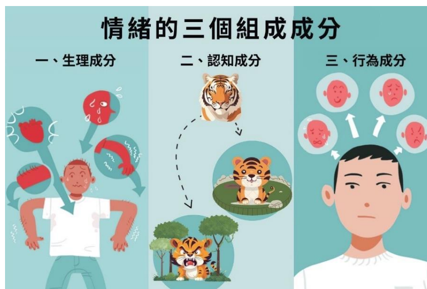
圖片說明：情緒的三個成分

雖然我們把情緒分成三個成分來說明，但這些並不是完全分開獨立的，當我們感受到情緒，通常都是由三個成分同時運作而成。